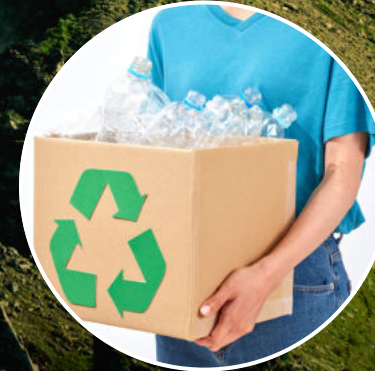
Einsatz von überwiegend erneuerbaren und/oder recycelten Materialien