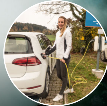
Umstellung VAUDE-Fahrzeugflotte auf E-Mobilität