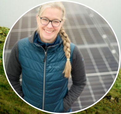
100 % Ökostrom am Firmenstandort

Die Klimastrategie von VAUDE setzt transparent konkrete, wissenschaftsbasierte Ziele, um die Treibhausgas-Emissionen des Unternehmens schnellstmöglich zu reduzieren.