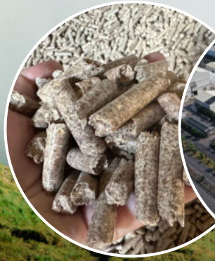
Projekte zur Energieeinsparung und Umstieg auf erneuerbare Energien in unserer globalen Lieferkette