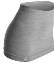
0176 grey melange