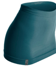
0076 dark petrol