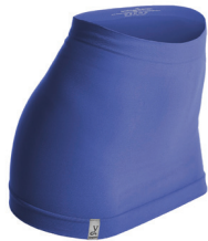
0159 dazzling blue