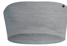
0176 grey melange