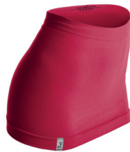
0008 ruby red