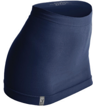
0004 nautic blue