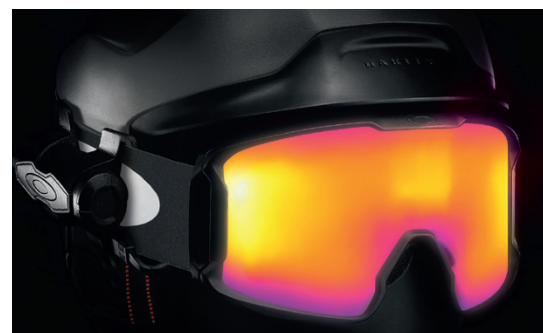
Oakley Prizm Inferno