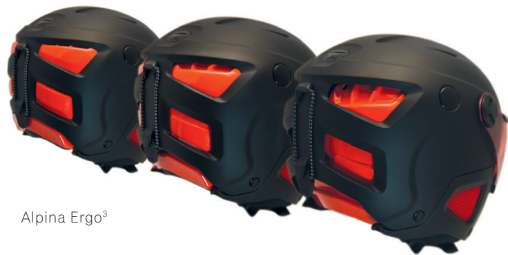
Alpina Ergo 3

Die Entwicklungsabteilung von Scott hat mit der 360° Pure Sound Technology den Schwerpunkt auf die akustische Wahrnehmung gelegt. Die Wahrnehmung der Umgebungsgeräusche kann besonders im Backcountry sehr wichtig sein. 360° Pure Sound besteht aus Mikroperforierungen im Earpad, das zudem aus geräuschkundlichen Materialien gefertigt ist und über ein Trompeten-Design direkt über dem Ohr verfügt. Das Resultat ist eine bis zu 25 % bessere Lokalisierung von Geräuschen. Bei Geräuschen, die von vorne oder hinten kommen, verbessert sich die Lokalisierung sogar bis zu 200 %.