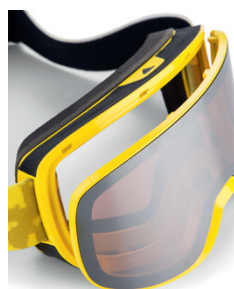
Adidas Quick Lift Lenspod System