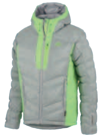
Primaloft Gold Insulation Down Blend in der Adidas Terrex Climaheat Ice Jacket

kraft von 750 cuin Gänsedaunen vergleichbar ist, jedoch selbst im nassen Zustand 90% der Wärmeleistung liefert. Die neue Hybrid-Isolation behält selbst nach zehn Waschgängen ihre Eigenschaften und trocknet viermal schneller als unbehandelte Daune. Das Hybrid-Produkt gibt es in den zwei Varianten Gold und Silver: Gold besteht zu 70% aus grauer Gänsedaune und 30% Primaloft Mikrofasern, Silver aus 60% weisser Entendaune und 40% Primaloft Mikrofasern. Zum Einsatz kommt es für Winter 2014/15 in zahlreichen Kolle-