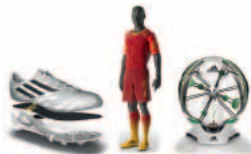
99 g Fußballschuh, 630 g Kit und Smart Ball.

An einer Innovationsveranstaltung anlässlich des Champion League Finals in London hat Adidas einen Blick in die Zukunft zugelassen. So wurde ein Fußballschuh mit einem Rahmen aus Verbundmaterial und einer leichten Aussensohle präsentiert, der