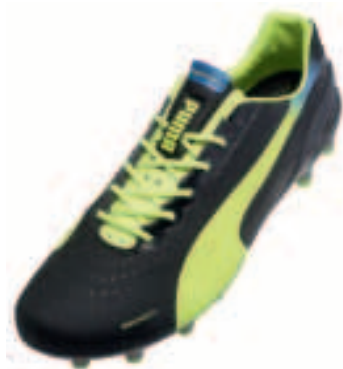
Puma EvoSpeed 1.2

Situationen einzuleiten, spricht Nike mit dem CTR 360 Maestri an. Abgerundet wird das Angebot mit dem Tiempo Legend, der hervorragendes Ballgefühl, Tradition und hochwertige Verarbeitung vereint.